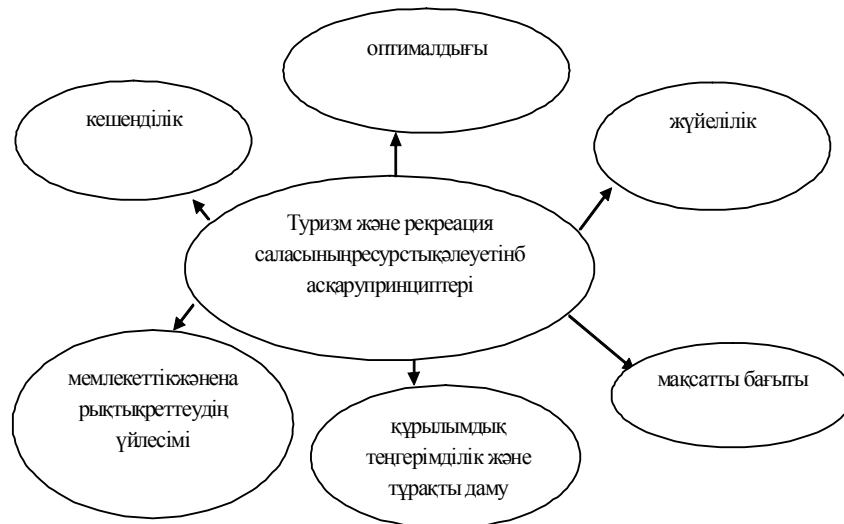
Сурет 1. Туризм және рекреация саласының ресурстық әлеуетін басқару принциптері

Іс жүзінде әрбір туристік аймақ әр түрлі дәрежеде туризм және рекреация саласында ресурстық потенциалға ие. Яғни, оның дербес басқару объектісі ретінде бөлінетін әлеует ретінде ресурстық ресурстарын тиімді басқару шартында ғана жүзеге асады. Туризм және рекреация саласының ресурстық әлеуетін басқару объектінің ерекшелігіне байланысты басқарудың жалпы принциптеріне ғана емес, сонымен қатар 1-суретте көрсетілген принциптерге де негізделеді.