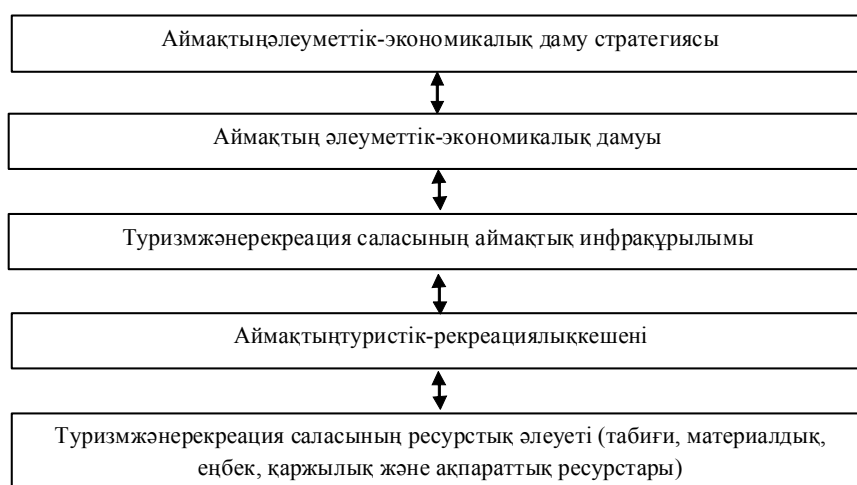
Сурет 2. Туризм саласының ресурстық әлеуетінің аймақтық стратегиялық әлеуметтік-экономикалық дамумен өзара байланысының сызбасы

ортаға мониторинг жүргізу үшін ақпараттық базаның, бақылау жүйесінің, бәсекеге қабілеттілікті қолдау жөніндегі тиімді шараларды жоспарлаудың және енгізудің болуы қажет. Мониторинг деректерінің базасында өңірдің мақсаттары мен ресурстық мүмкіндіктерін біріктіру үшін перспективалық жоспарлар мен оларды енгізу жөніндегі шараларды әзірлеу орынды. Туризм және өңір аумағының рекреациясы саласындағы ресурстық әлеуетті пайдалануды стратегиялық жоспарлау процесі кейбір басқа рекреациялық факторларға едәуір аз көңіл бөле отырып, туристік ресурстар тартымдылығының аса маңызды факторларын пайдалануды қамтамасыз ету бойынша бәсекеге қабілетті туристік ұсыныстар жасауға мүмкіндік береді. Туризм және рекреация саласындағы өңірдің ресурстық әлеуетінің өңірдің стратегиялық дамуының әлеуметтік-экономикалық процестерімен өзара байланысының схемасы 2-суретте көрсетілген.